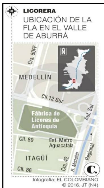
Ilustración 1 Ubicación FLA

La finalidad de este documento es presentar los resultados de un estudio de caso con metodología mixta en donde se analizan las posibilidades de transformación del uso del suelo del inmueble donde se asienta actualmente la Fábrica de Licores y Alcoholes de Antioquia en el extremo norte de la Ciudad de Itagüí y el efecto estimado de esos cambios en las rentas fiscales del Municipio de Itagüí, específicamente en los recaudos de impuesto de predial unificado y de industria y comercio. Este estudio presenta una modelación de tres escenarios diferenciales posibles aplicados al predio encontrándose resultados extremos y uno intermedio, siendo, para el propósito de las finanzas municipales, muy conveniente