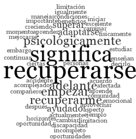
Nube de palabras ¿Qué significa desarrollar un proceso de rehabilitación? Encuesta de opinión PERTINENCIA Y COMPATIBILIDAD DEL SISTEMA DE REHABILITACIÓN INTEGRAL BRINDADO EN EL BASAN Y CRI (2020)

Teniendo en cuenta lo anterior, se refleja a continuación una gráfica que emerge en un escenario de análisis sobre la pregunta abierta ¿Qué significa para usted desarrollar un proceso de rehabilitación? que fue respondida por 30 participantes de la encuesta desarrollada entre el mes de septiembre del 2019 y el mes de febrero de 2020. Un conjunto de respuestas que se fueron agrupando en el programa Nvivo con un nodo específico denominado significado de la rehabilitación y analizado por medio del método nube de palabras que permitió identificar las 50 palabras más frecuentes con longitud mínima de 8 letras en los relatos.